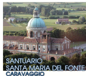
SANTUARIO SANTA MARIA DEL FONTE CARAVAGGIO